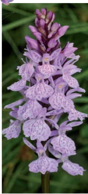
Dactylorhiza maculata (mauve)