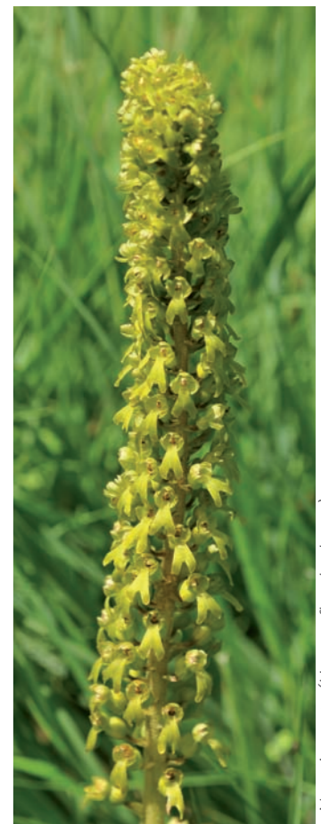
Neottia ovata (Hampe florale dense)