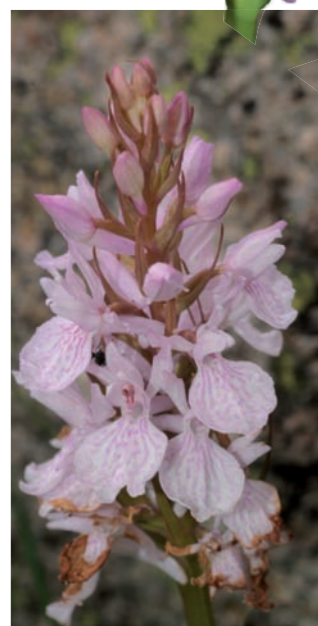
Dactylorhiza maculata (rose)