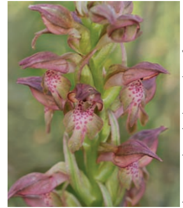
Anacamptis coriophora subsp. fragrans